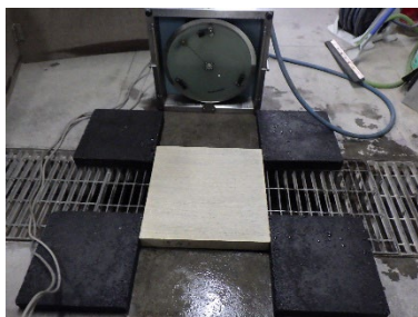
写真4 すべり抵抗試験状況