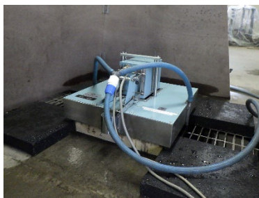
写真5 すべり抵抗試験状況 (固化型 KK)