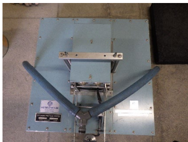
写真1 DF テスター