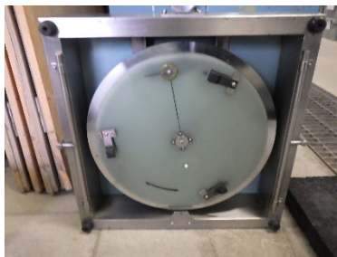
写真2 DF テスター (裏面)