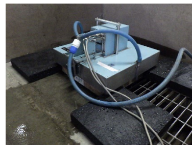
写真6 すべり抵抗試験状況 (無塗布)