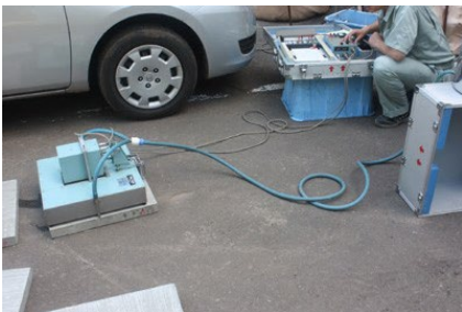
写真6 すべり抵抗試験状況-1