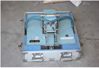
写真1 DF テスター