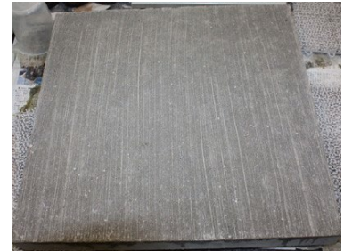
写真5 表面含浸材塗布後の基板