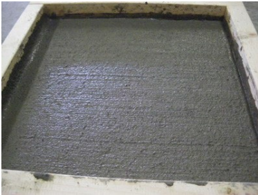
写真3 基板の打設状況