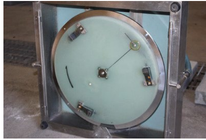
写真2 DF テスター (裏面)