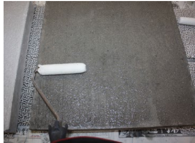
写真4 表面含浸材塗布状況