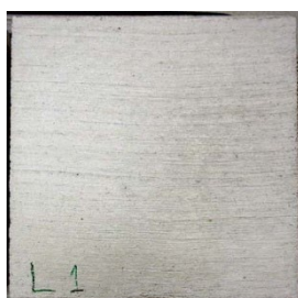
写真4 表面含浸材塗布試験体