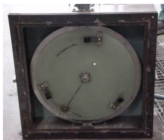
写真2 DF テスター (裏面)