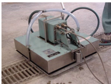
写真1 DF テスター