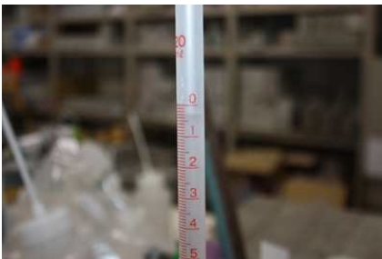
写真8 試験終了後状況 (1回目試験)

2回の試験両方で7日間の透水量が1.0 mL未満と非常に少なく、電柱試験体には水が浸透し難いことが確認された。