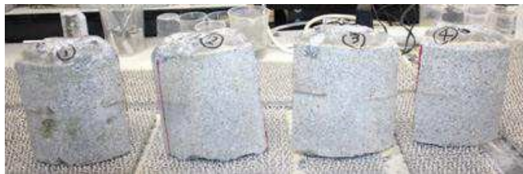
写真2 4分割した電柱試験体