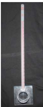
写真3 透水量試験器-1