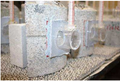
写真6 透水量試験器貼付状況