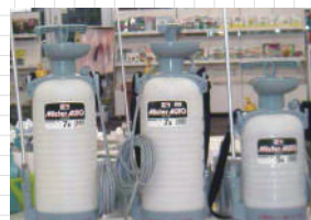
手動蓄圧式噴霧器